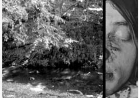
Ici prend place une légende

Dans « paysages de la guerre », Sabine Würich a travaillé à partir des photographies réalisées par une congréganiste catholique sur son lieu de travail, l'Hôpital S te Elisabeth de Cologne-Hohenlind, de 1930 à 1950. Ces photographies de blessés de guerre, de corps estropiés, mutilés ont fait l'objet d'une donation auprès du centre de documentation nazie de Cologne. En re-photographiant les portraits de personnes blessées au visage et en utilisant différents formats, Sabine Würich met l'accent sur la vulnérabilité des êtres et sur l'individualité de la victime de guerre. Chaque portrait est associé à un extrait photographique de paysage : cette nature vierge en apparence est le théâtre de la guerre – anciens champs de bataille de la forêt de Hürtgen, lieu de la plus longue bataille menée sur le sol allemand –, un lieu historiquement « contaminé ». Ainsi se crée un dialogue entre ce qu'il s'est passé (les actes de guerre) et les conséquences (mutilations) ; les blessures des hommes trouvant leur reflet dans le façonnage du paysage, tous deux maltraités par la violence des conflits.