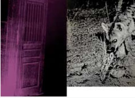
Crocuta, 2009 (détail)