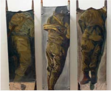
Sans titre/ Ohne titel, 1995-2007