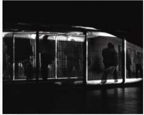
Ligne de démarcation 1/ Demarkationslinie 1, 2005-2006