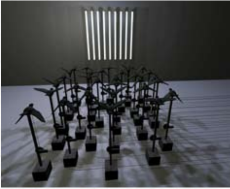
Les Dupes / Lockvögel, 2010