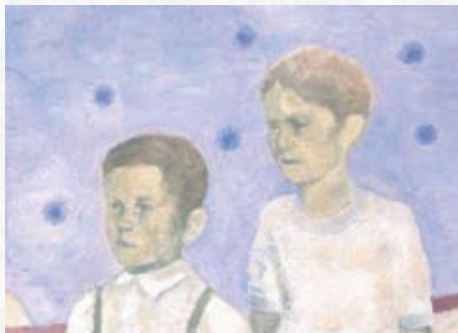
Hänsel und Gretel, 2005 (détail)

Thomas Lohmann recourt au réservoir d'images et de photographies de la période nazie et se consacre à des personnes, à des lieux, à l'ordinaire. Le mélange de fascination et de peur, d'étrangeté de ces représentations est soutenu par une peinture à l'huile sur cire, technique qui prend son origine dans l'Antiquité. Les figures et les espaces soumis à des teintes et des contours évanescents, sont extraits du temps et de leur contexte. Ainsi transformés, ils agissent comme des apparitions figées. Si le choix des motifs peut être l'objet du hasard, ces derniers peuvent aussi être rassemblés de manière intentionnelle – comme dans Greta et Portrait – pour raconter un acte ou un événement chargés de toute la déshumanisation des conflits.